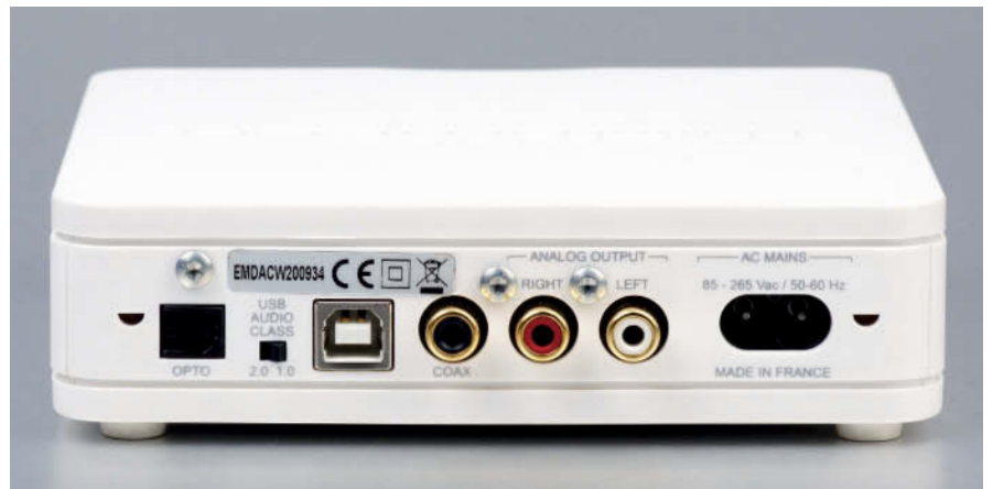
▲MyDAC採交換式電源設計，除基本USB、光纖、同軸數位輸入，與類比輸出外，左下方還有一個可以選擇USB 1.0或2.0傳輸模式的開關。

系列產品的領頭羊。按照Micromega的計畫，之後還會推出六部「My」系列產品，分別有My Z I C耳擴，MyGROOV MM/MC唱頭放大器，MyDISC CD播放機以及型號未定但肯定會支援高音質檔案傳輸的無線DAC與綜擴、前後級產品。這六款「My」系列產品的體型都會與MyDAC一樣袖珍，聲音表現也是秉持最高標準打造。在聽過MyDAC的實際表現後，更讓我迫不及待想快點玩賞其他My系列機種。(百鳴04-2463-7788) ▲